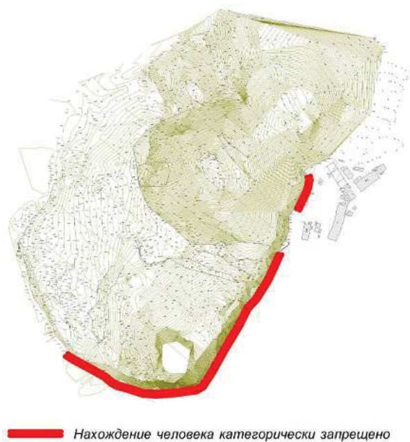
Рис. 5. Цифровой план