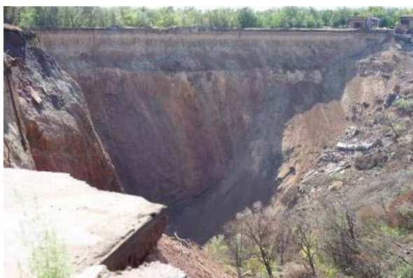
Рис. 1. Образование воронки

Проблема и её связь с научными та практическими задачами. При добыче полезных ископаемых подземным способом применяются различные системы разработки, а главными факторами выбора той или иной системы служат геологические, геофизические и экономические факторы. В середине XX века на Криворожской шахте им. Орджоникидзе была принята система разработки, при которой предусматривается выход воронок на дневную поверхность. 18 марта 2010 года в горном отводе шахты им. Орджоникидзе, при выполнении плановых взрывных работ, на поверхность вышла одна из таких воронок. Событие произвело огромный резонанс, так как это случилось в непосредственной близости к жилым постройкам, а подземные толчки были слышны почти на всей территории стокилометрового города. В результате этого, равнинная территория площадью 12 га в течении 10 минут превратилась в воронку с минимальной и максимальной отметками +45м и +125м соответственно (рис. 1). Согласно выполненным расчетам, объем образовавшейся пустоты приблизительно 1,8 млн. м 3 .