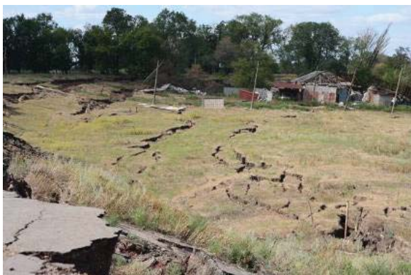
Рис. 3. Прилегающие территории покрыты трещинами

Изложение материала и результаты. Так как в результате выхода воронки «погашена» только часть подземных пустот, то для эффективного мониторинга необходима съемка непосредственно поверхности воронки. Нахождение человека внутри воронки исключено, так как в любой момент может произойти дальнейшее обрушение, а в местах террас и трещин наблюдаются углубления до 3 метров и раскрытием от 0,3 м до 2 м (рис. 3).