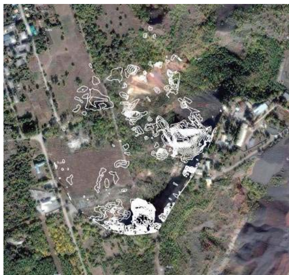
Рис. 7. Изолинии осадок

Данная методика в настоящее время исследуется и совершенствуется. Поэтому, еще не получены окончательные данные о состоянии массива, но с достаточной точностью решена задача выбора места съемки и участка, необходимого для проведения дополнительных исследований.