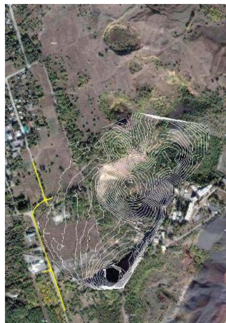
Рис. 6. План воронки

Сочетание метода наземной стереофотограмметрической съемки и безотражательной тахеометрии дает хорошие результаты с точки зрения оперативности и точности, но при построении цифровой модели рельефа необходимо решать задачу при отсутствии некоторых исходных данных.