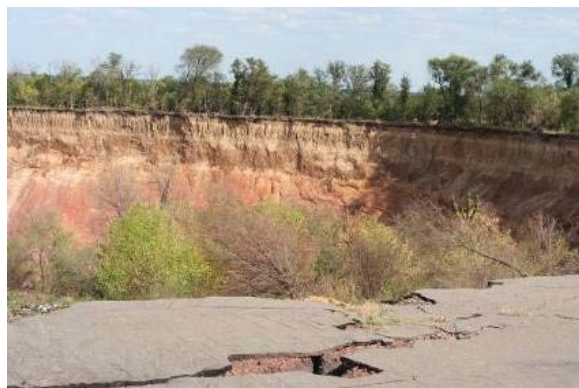
Рис. 4. Нестойкие козырьки на краях воронки

Поэтому, в данном случае речь может идти только о дистанционных методах съемки. Выполнение съемочных работ дистанционными методами на данном объекте усложняется большим количеством специфических факторов, которые несвойственны другим объектам.