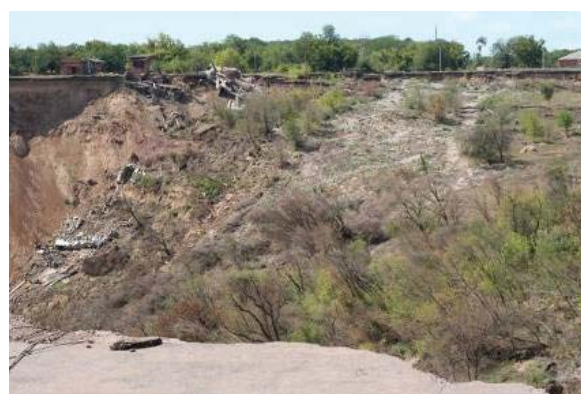
Рис. 2. Границы воронки в непосредственной близости от поселка

Анализ исследований и публикаций. Теорию прогнозирования состояния территории, подрабатываемой горными работами, развивают отечественные и зарубежные ученые [4, 5]. Заслуживает внимания использование современных компьютерных технологий и новых математических методов [1, 2, 3]. Эффективным является применение современных высокоточных приборов для выполнения инструментальных наблюдений.